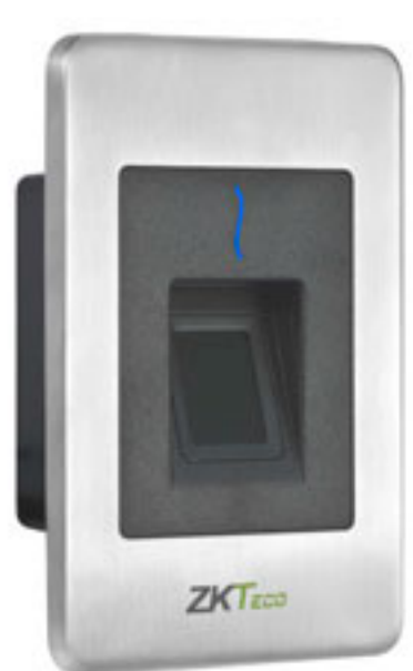
RS485 считыватель отпечатков