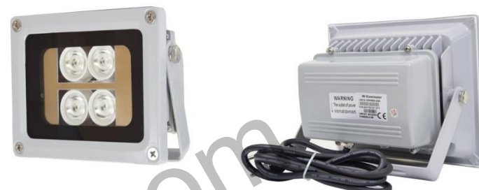
Габарити (ВхШхГ): 221 x 170 x 80 см