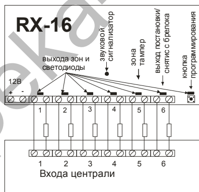
Схема подключения к централи с выносными резисторами