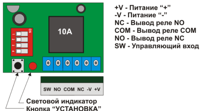
Рис. 1. Схема подключения

Таймер микропроцессорный SOKOL TM-10 предназначен для управления питанием нагрузки. Контакты реле гальванически развязаны с питанием устройства, что позволяет подключать коммутировать не только слаботочную нагрузку, но и сеть 220В. Обратите внимание что запрещается коммутировать приборы с потреблением более 1.1кВт. Устройство позволяет настроить время работы, ожидания и задержки включения от 1 до 65000с. SOKOL TM-10 имеет два режима работы. Кнопка «УСТАНОВКА» позволяет легко и просто настроить устройство. Для индикации работы есть светодиод.